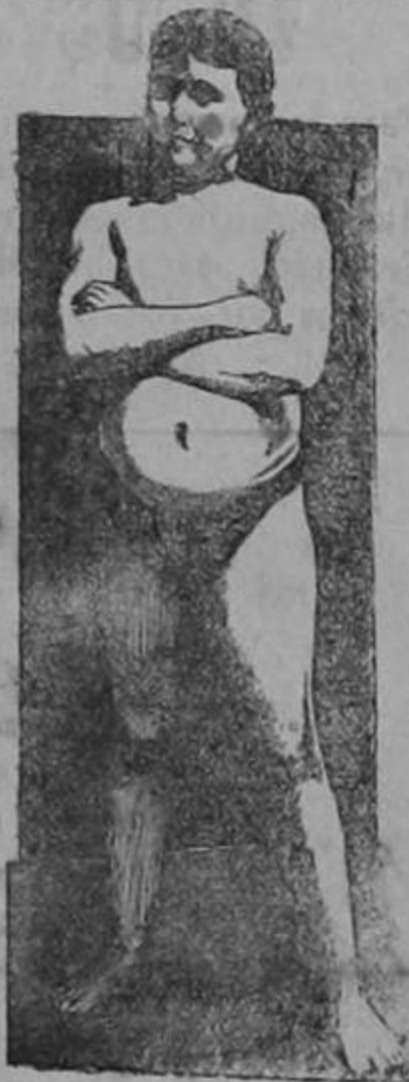
EDAD 11 AÑOS

La transformación maravillosa de un sér endeble y raquítico en un adolescente fuerte, robusto y sano, como lo demuestra su atlética figura, fué obra realizada por la